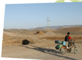
Gevolgen van ontbossing