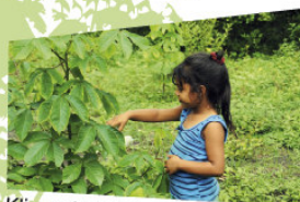
Klimaatbos in León

Meer weten over het klimaatbos? Lees het in de Millenniumkrant Utrecht 2010 of kijk op www.klimaatbos-leon.nl