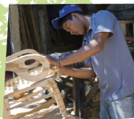
Hout voor lokale bedrijven