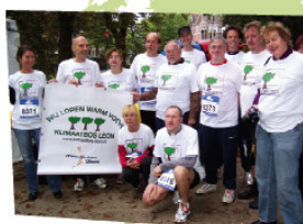
Singelloop 2010 team Milieucentrum Utrecht